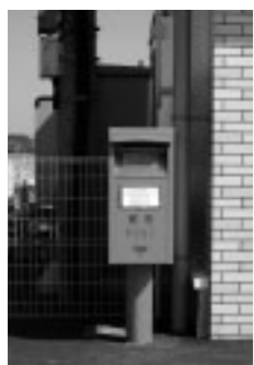
▲セブンイレブン福岡駅南店に移設しているポスト

③ A ご意見ありがとうございます。ポストの設置に関しては郵便局が管轄していることから、福岡駅郵便局に伺い、福岡駅舎さいごう口側への郵便ポスト設置について要望を伝えてきました。