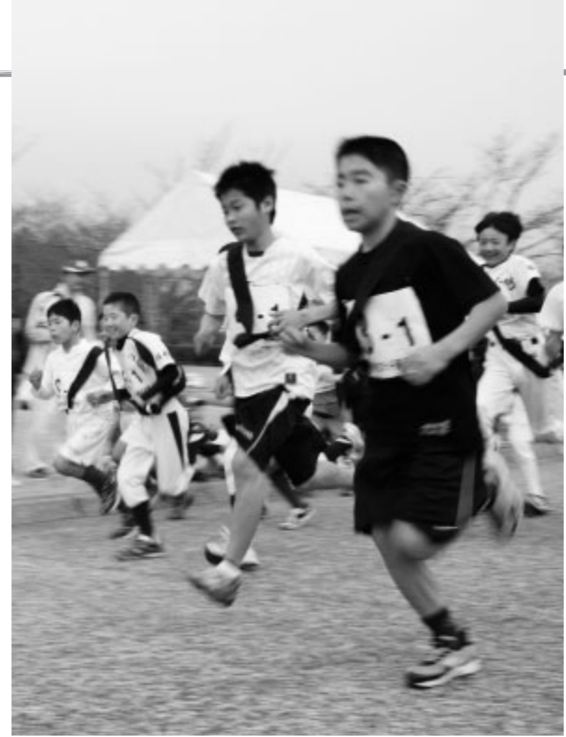
▲1周1.2kmのコースを懸命に走る小学生たち