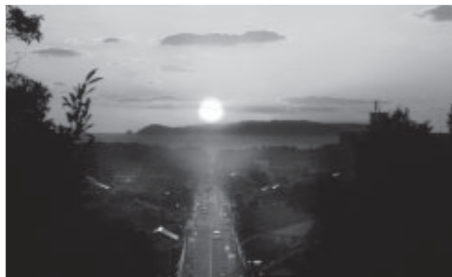
▲2月23日に宮地嶽神社から撮影された写真