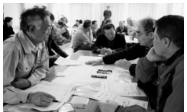
▲花見公民館で、避難所の運営方法について話し合う市民

2月16日、花見地域の自主防災組織が、避難所運営訓練を行いました。約80人の市民が集まり、避難先となる福間中学校を視察した後、花見公民館でグループごとに討議しました。参加者の一人は「阪神大震災や東日本大震災の教訓を学べた。災害のときは、避難所は自分たちで運営していかなければならない。今度は自分たちだけでゆっくりと時間をかけて運営プランを煮詰めたい」と話していました。