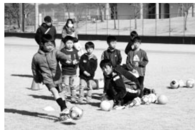
▲インサイドキックの指導を受けている様子