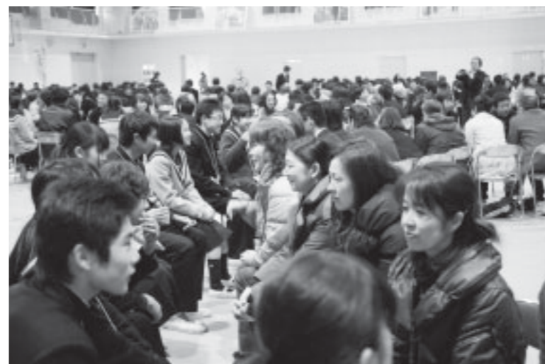
▲中学生が一つずつずれて会話。さまざまな大人と会話できる