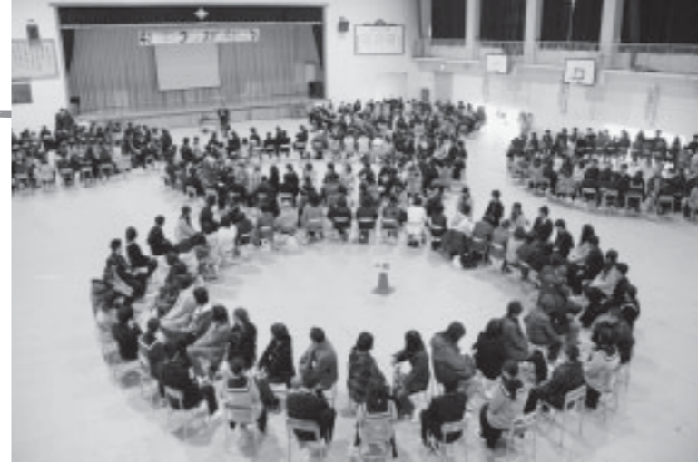
▲向かい合って座り会話する