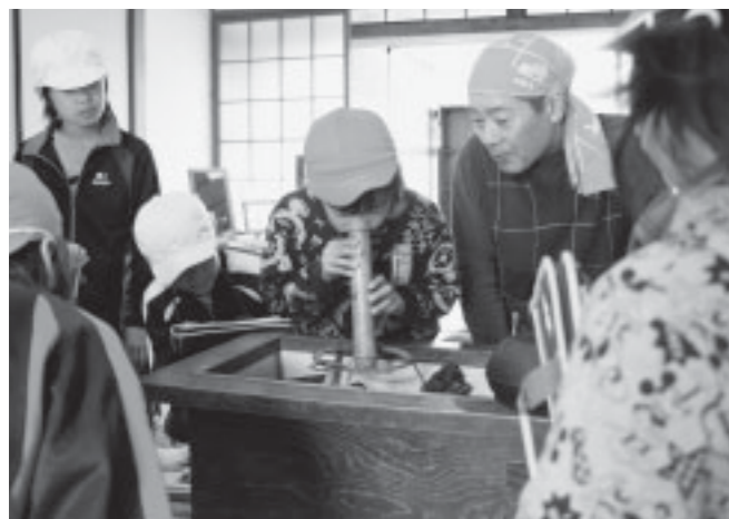
▲竹の筒を使って、炭に火を付ける方法を体験

豊かな農産物の『ほんもの』に触れてほしいという思いから、親子で参加できるクッキング教室や『カリフラワー＆ブロッコリー畑』を再現した展示、獲れたて野菜の物販コーナー、福津産検定と題した検定試験など、盛りだくさんの二日間となりました。