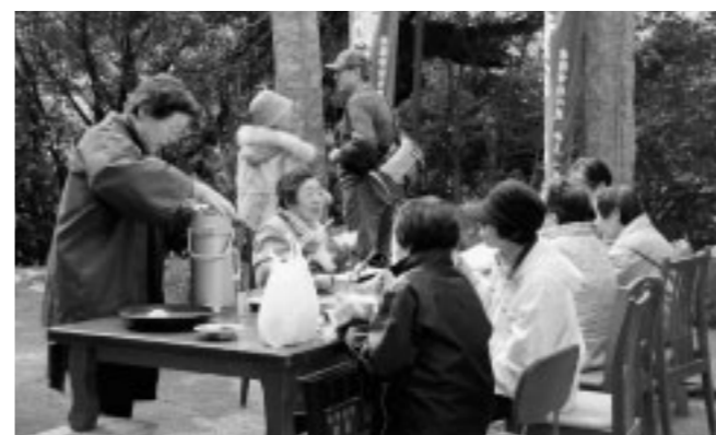
▲参拝の後には手作りのぜんざいや漬物が振る舞われました

八並の小高い森の中にある八並不動尊には、毎月28日を縁日として参拝者が訪れます。その中でも2月28日に行われる年に一度の大祭は、朝早くから多くの人たちで賑わいました。参拝者には熱心な人も多く、毎年、北九州や佐世保、遠くは京都から足を運ぶ人もいます。「もっと多くの人に八並不動尊のことを知って訪れてもらいたい」ここを昔から大切に守る地域の世話役のかたの言葉です。