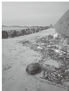
▲花見浜漂着のココヤシ

漂着したココヤシ (ヤシの実) ココヤシは東南アジアに分布するヤシです。現在でも日本各地の海岸に漂着しますが、古くは約5500年前(縄文時代)の福井県鳥浜貝塚で容器の出土があります。福津市への漂着は『福岡町史自然編Ⅲ』で紹介されていますが、実際に市近辺の海岸を歩いて探してみました。写真は幸運にも踏査4日目に花見浜で毛むくじらのココヤシを発見したときのものです。外側は繊維質の中果皮で、古代人はこれを剥いた堅い殻の内果皮を利用してました。市内では昨年、弥生時代の土笛が発掘されましたが、ココヤシ製の笛を真似して作ったとする説もあります。説の真偽はともかく、福津の古代人もこの南海からの不思議な贈り物の存在を知っていたのは確かです。発見の喜びを古代人と共有できた気がします。