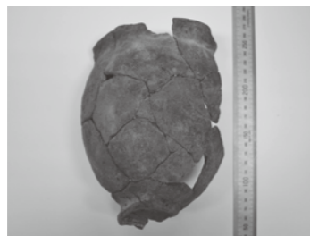
▲脚台の付いた甕形土器

写真は米の煮炊きに使われる甕形土器です。残念ながら半分ほど欠けていますが、おおよその全形はうかがえます。この土器の底部分(土器下部)には脚台と思われる突起が残っています。当時の北部九州の甕形土器に脚台を付ける習慣は一般的でなく、熊本地域などの中部九州地方の土器によくみられる特徴です。中部九州からもたらされた可能性や、中部九州の土器を真似て作った可能性が考えられ、遠隔地との交流を示す物証といえるでしょう。