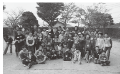
全員ではいチーズ!

「さわやか衛生管理事業」を 実施します。 さわやか衛生管理事業は、寝たきり状態などの理由から、寝具の衛生管理が困難な在宅の高齢者に対し、訪問指導および支援サービスを提供することにより、状態の改善、身体の清潔の保持(感染症の予防)および介護者の負担軽減を図ることを目的としています。 このたび、春 season を実施しますので、利用を希望の人は申し込みください。申請後、訪問調査を行い利用の可否を決定します。 対象者 65歳以上の介護保険制度における要支援または要介護と認定された人で、自宅で生活しており、寝具類などの汚染があつて衛生管理が困難な人 サービス内容 ・介護者への環境改善および寝具取り扱い指導