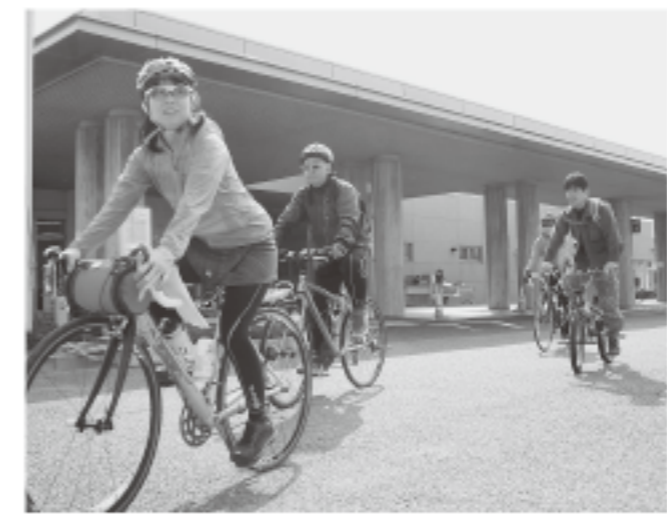
▲お茶を持って、宮司コミュニティセンターを出発

3月16日、自転車さんぽ2014が開催されました。地図に示された市内の各所の計26カ所のポイントの中から8カ所以上を選んで3時間以内にクイズに答えながら巡ります。