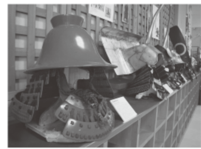
▲かぶとズラリと並びました

2月19日から3月31日までの間、人気大河ドラマ「軍師官兵衛」にちなんで、手づくりで仕上げられた「かぶと」が潮湯の里夕陽館に展示されました。