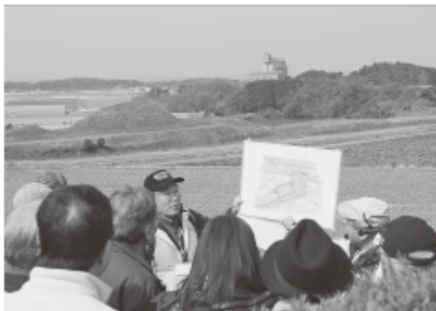
▲新原・奴山古墳群を見渡しなが詳しく説明

県内で観光ボランティアガイドとして活躍している人たちのガイド技術の向上、人材育成などを目的に、観光ボランティアガイド大会が2月21日に開催され、市内外から観光ボランティアガイドに携わる多くの人たちが福津市に集まりました。