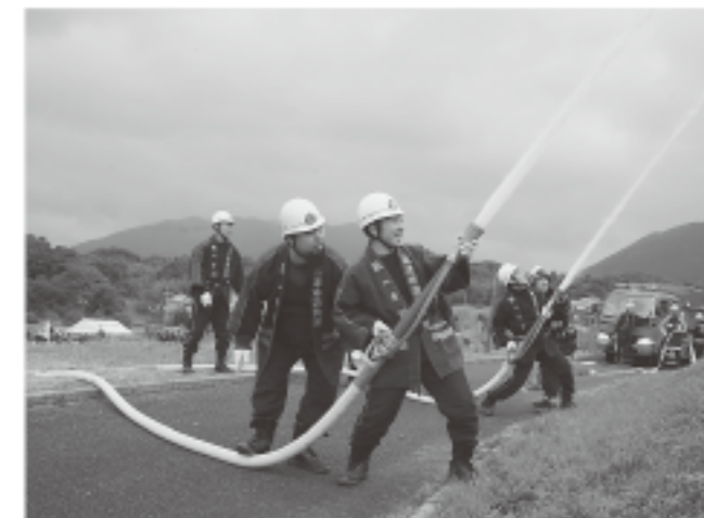
▲水圧に耐えながら放水する福津市消防団第1分団

3月2日、宗像市山田のふれあいの森総合公園で林野火災が発生したことを想定しての訓練が行われました。