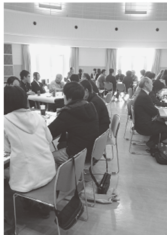
▲ワールドカフェにより、参加者が自由に会話をしました