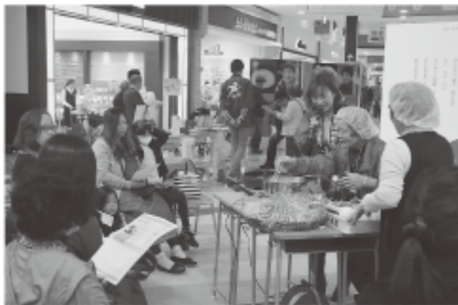
▲イオンモール福津で、野菜を使ったレシピを紹介

3月1日と2日の2日間、イオンモール福津で、カリフラワー、ブロッコリー、キャベツ、トマトなど、福津市自慢の旬の野菜たちが集合する「福津のベジ学校」を開校しました。