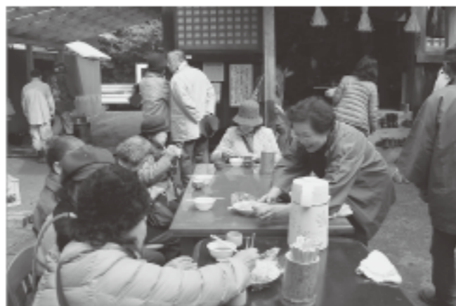
▲「手作りのぜんざいを目当てに来ました」という人も

「近くに住んでいますが八並不動尊のことは知りませんでした。今回初めて来ました」というかたも。賑わいは年々増してきているようです。