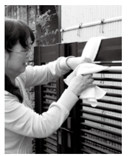
▲周りに無事知らせるタオル

市は昨年引き続き、携帯電話、防災行政無線を使い「福津市一斉防災訓練」を行います。家族間で災害で家族が離れた場合の連絡方法や非常持ち出し品の点検を、訓練の前日までお願いします。当日は、合図のもと、家庭内では1分間ほど防護姿勢をとってください。そして、家から出て、隣近所同士で顔を合わせてください。家を出る際は「この家は無事に避難しました」の合図となるタオルを玄関先に掲げることが忘れ