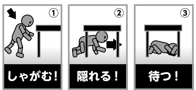
▲地震発生の放送を聞いたら、①しゃがむ②机などの下で隠れる③揺れが収まるまで待つ

ふみの日イベント 2016を開催します さまざまな方法で手紙を作るワークショップや、郵便屋さんのユニフォームの試着