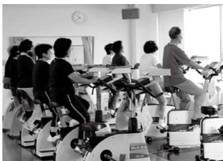
▲景色を眺めながら運動できます