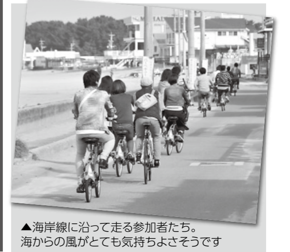
▲海岸線に沿って走る参加者たち。海からの風がとても気持ちよさそうです

性別に関わらず、一人一人が輝ける社会を目指す福津市。このコーナーでは、市や市民の「男女がともに歩む」取り組みを紹介します。