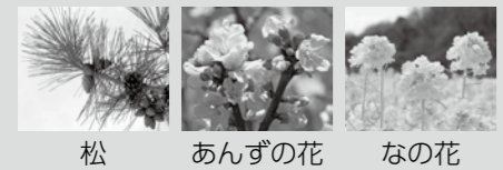
松 あんずの花 なの花