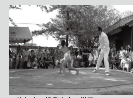
▲昨年度の相撲大会の様子

今月は「親子野外活動支援事業」を紹介します。 親子で野外に飛び出そう! 親子野外活動支援事業は、身近な自然に触れることで心身のリフレッシュを図り、親子の体験活動のきっかけを作ることを目的に開催しています。 福津市の恵まれた自然の中に一歩足を踏み入れると、たちまち五感が刺激され、普段の生活では得られない感動や感覚に出会えます。親子いっしょにさまざまな体験を通して、自然のすばらしさを実感してみませんか。 平成29年度の活動については郷育かわら版にて随時お知らせしますので、ぜひ御応募ください。