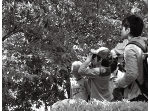
▲今年度の活動の様子 (右上) 海洋スポーツに挑戦! (右下) バードウォッチング (左上) 植物観察 (左下) 川の生き物調べ

受付期限 4月7日(金) 受付方法 電話またはファクス 受付、問い合わせ 市郷育推進課 ☎62・5078 FAX 43・9004 ※ファクスの場合は、送信後に確認の電話をしてください。 ※定員を超える場合は抽選になります。抽選結果は、はがきでお知らせします。 郷育推進課からのお知らせ 福津市成人(300歳)ソフトボール大会を開催します 日時 5月14日(日) 午前8時20分開会 ※雨天中止 会場 なまずの郷、みずがめの