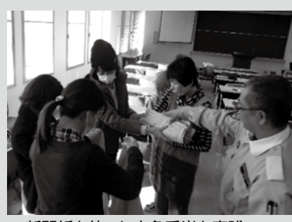
▲新聞紙を使った応急手当を実践

講座あれこれ 「カメラリポーター」 郷育カレッジには大人も子どもも楽しく学べる講座がたくさんあります。このコーナーでは、最近開催された講座を写真で紹介します。 手を差し伸べる あなたの応急手当