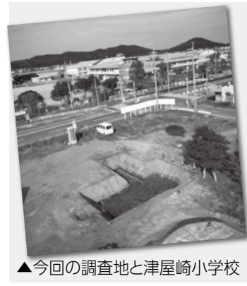
▲今回の調査地と津屋崎小学校

今回の調査でも青磁や白磁などが出土し、屋敷のあった場所の周囲に巡らされた溝や、建物などの柱穴が見つかりました。小規模でも調査例が増えれば、当時の家並みなど貿易の窓口としてにぎわった様子を、少しずつ復元できると思います。