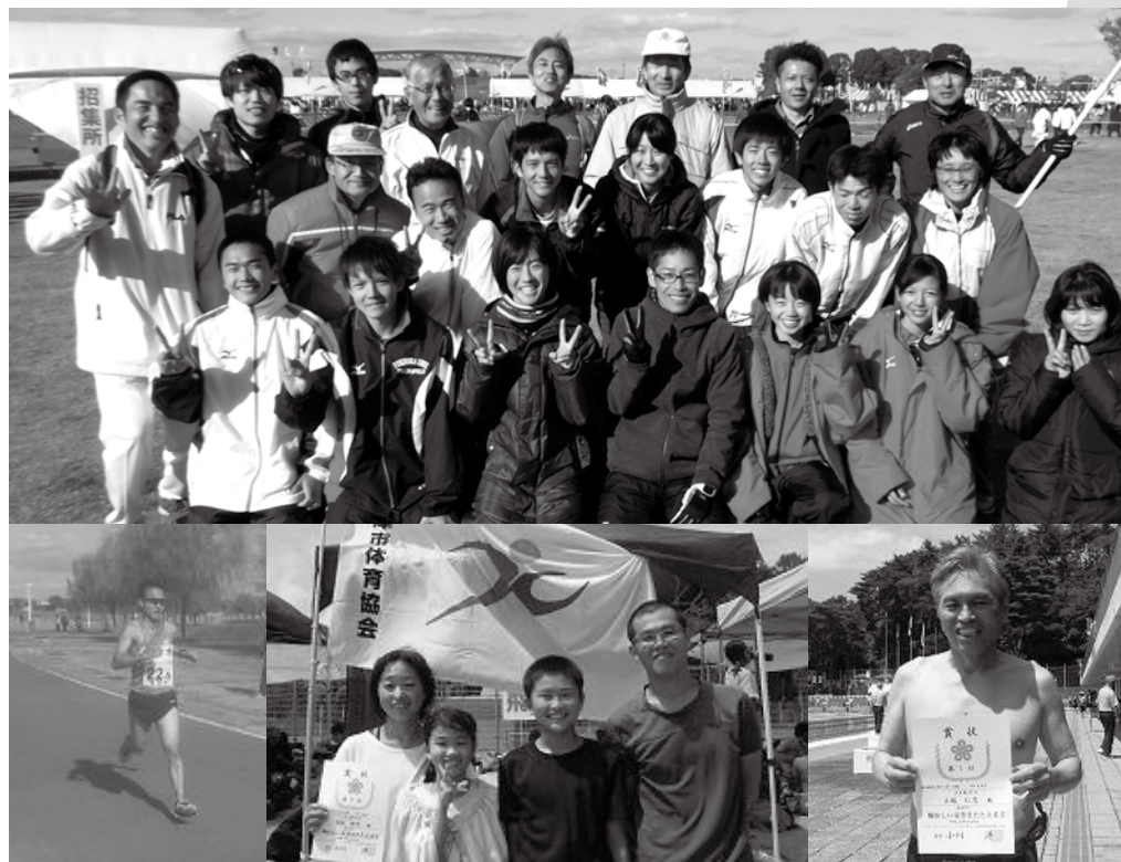
▲大活躍の市代表選手の皆さん