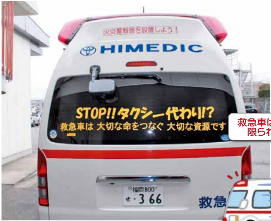
市民の皆さんのご理解とご協力をお願いします