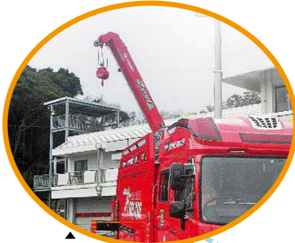
2.9tまでの重量物も軽々持ち上げるクレーンや、夜間での活動に大活躍の照明も装備しています。

今回配備した救助工作車は、さまざまな救助資機材を備えており、あらゆる災害に対応できる仕様となっています。