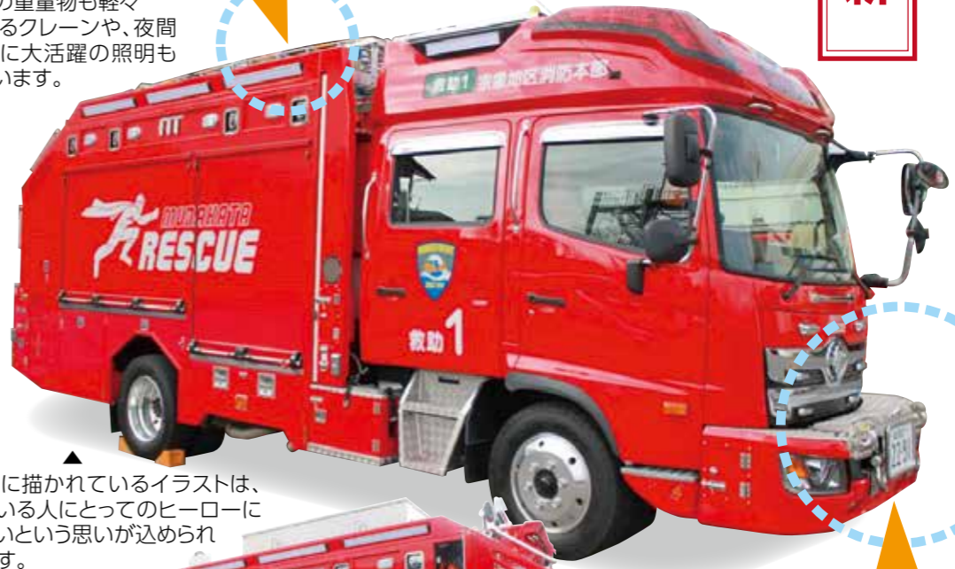
車両横に描かれているイラストは、困っている人にとってのヒーローになりたいという思いが込められています。