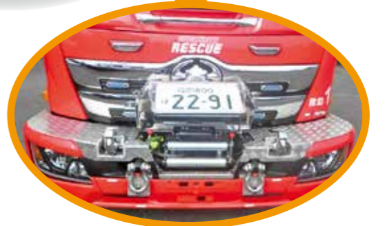
▲交通事故現場などで使用するフロントウインチを備えています。