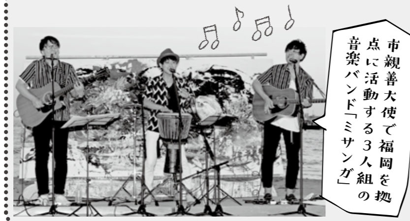
市親善大使で福岡を拠点に活動する3人組の音楽バンド「ミサガ」

対象 市内在住の中学生、高校生、大学生(専門学校生などを含む) 定員 10人 ※応募多数の場合は選考により決定します 受付方法 住所、氏名、生年月日、電話番号、学校名、保護者氏名、歌に込めたい思いや言葉をメールかファクスで連絡 受付期限 7月16日(火) 午後5時 受付、問い合わせ 市郷育推進課 ☎62・5078、FAX43・9004 メール goiku@city.fukutsu.lg.jp