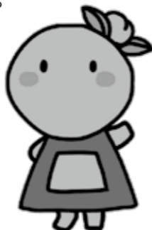
市古墳キャラクターのふんちゃん

世界遺産セミナーなど、他にも各地で楽しい催しがたくさんあります。詳しくはホームページをご覧ください。