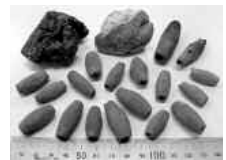
▲出土した土鍾と軽石

上西郷ニホンスギ遺跡は水光会病院西側の水田下にあり、西郷川左岸に面した遺跡です。戦国時代の掘立柱建物や溝が発掘され、土器や陶磁器のほか、土鍾が28点出土しました。土鍾は粘土を焼いて作った鍾で、漁網を水中に沈め、しっかり張るために使用します。出土品は中心に穴が貫通した形状で管状土鍾と呼ばれ、弥生時代から現代まで使用されています。出土したほとんどが重さ5g、長さ3cm前後と小型品で、小規模な漁網や投網など河川の漁で使われたようです。また軽石が4点出土し、うち2点に穴が開いていることから、土鍾とともに漁網に付けた浮きであろうと考えています。軽石は火山または海底火山の噴火で生じ海浜に漂着することから、流れ着いた軽石を拾い集めて利用したのでしょうか。