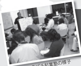
昨年のプチ起業塾の様子