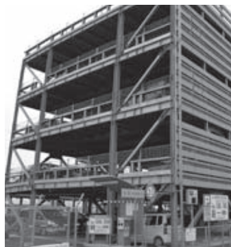
▲JR福岡駅立体駐車場

福岡駅みやじ口(西口)横にある有料駐車場については、JR九州が平成20年11月に「福岡駅立体駐車場」(収容台数230台)を開業し、営業を行っています。また、福岡駅さいごう口周辺の土地については、UR都市機構によって、福岡駅東地区画整理事業が行われ、宅地や道路などの都市基盤整備が進み、一部の地権者による土地活用が始まっています。