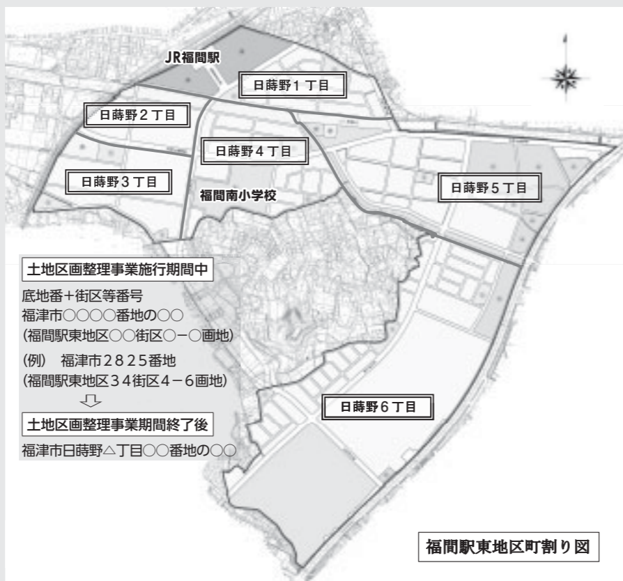
福間駅東地区町割り図

現在、福間駅東地区は、土地区画整理事業施行期間中のため、底地番と街区画地番号の二重表記を使用しています。新しい町名については、土地区画整理事業期間終了後の平成26年3月(予定)から使用します。