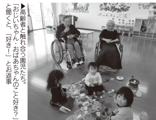
▶高齢者と触れ合う園児たち。「おじちゃん・おばあちゃんのこと好き」と聞く、「好き」とお返事

多く、クリスマス会などの行事を一緒にしたり、普段でも手作りおやつと一緒に作ったりしています。 高齢者にとって良い刺激であるのはもちろん、子どもたちにとっても高齢者との関わりは、優しい心を育むことにつながっています。 日曜日は休園、夜は午後7時までは、子育て中の従業員は平日の昼のシフトに入るといった配慮をされています。 母体が介護施設なので、大きな調理場があり、食事メニューは栄養士が考えて作ります。アレルギー対応の食事もでき、従業員が安心して子どもを預けることができる施設です。 市では、このように、子育て中の従業員のために取り組みを行っている事業所をこれからも紹介していきます。