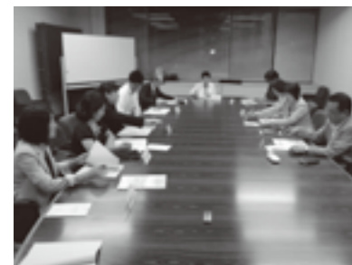
男女共同参画審議会もクオータ制を導入しています。クオータは「割り当て」などを意味し、4分の1のクォーターとは異なります。

クオータ制では、審議会などで男性と女性の双方が40%以上選出されなくてはならないとされています。この結果、議員や企業役員も約40%を女性が占めるようになりました。そのようにしてノルウェーでは多くの女性がさまざまな分野で活躍することにつながり、現在の状態になったのです。日本でも、法律に男女平等は明記されていますが、クオータ制導入までは至らず、国会議員や企業役員で女性が占める割合は世界の国と比較すると、とても低いランクです。