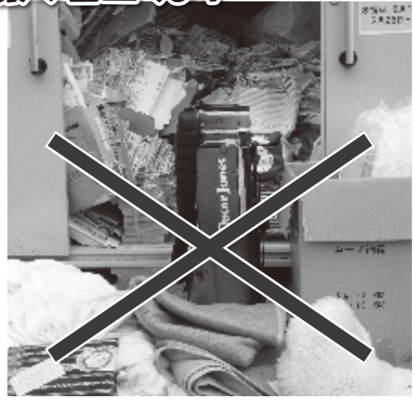
▲古布については、古着以外のものは回収できません。