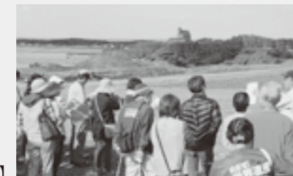
▲世界遺産候補地(新原・奴山古墳群)