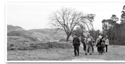
▲新原・奴山古墳群ガイド風景