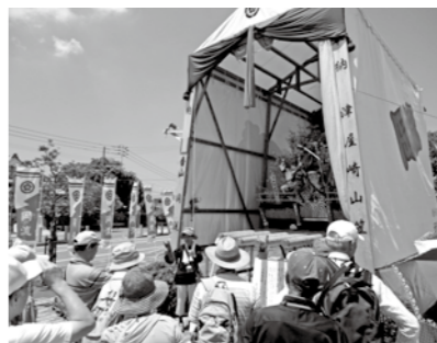
▲歴史や文化に触れるふるさと分野の講座