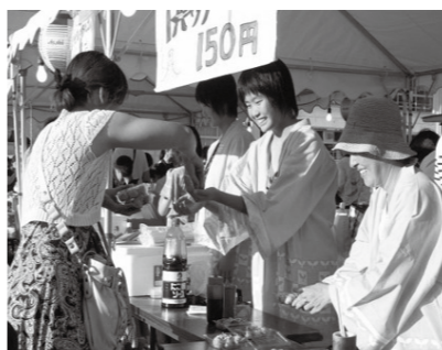
▲自治会夏祭りの手伝いなどの地域貢献活動

コミュニティ・スクールとは、学校運営に地域のかたが参画するもので、地域に開かれた信頼される学校づくりの