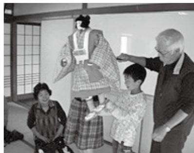
▲地域の人による人形浄瑠璃の指導

「少人数の学校に通わせたい」「自然豊かな環境の中で学び、もっと個性や長所を伸ばしてあげたい」と考える保護者のために、通学区の枠を越えて勝浦小学校に転入学できる勝浦小学校入学特別認可制度があります。制度の周