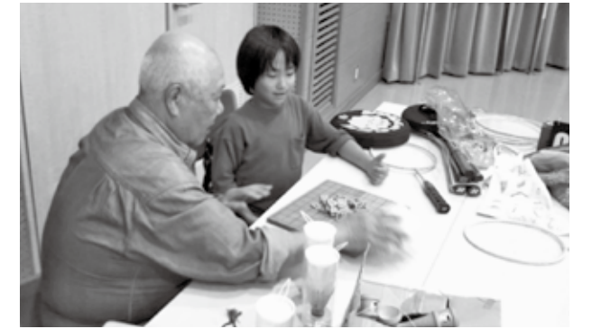
▲遊びながらのおしゃべりも楽しそうです

みやじアンビシャス広場は、毎週金曜日の午後4時から午後5時まで、宮司コミュニティセンターで活動しています。市内7広場のうち、唯一登録制ではなく、誰でも参加できます。他の小学校の児童と出会うきっかけになったり、地域の人と顔見知りになったり、たくさんの人と交流できます。5月29日から7月5日まで宮司コミュニティセンターが工事のため、活動は休みとなりますが、夏休みに実施予定の体験活動にぜひ参加してください。