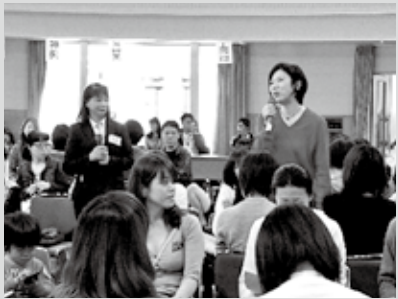
▲指導者研修にも取り組んでいます