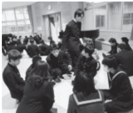
▲グループ討議の様子

暴力には、殴る・蹴るといった身体的な暴力の他に精神的な暴力も含まれます。その例としては ・メールの返信をすぐにするように強要する。