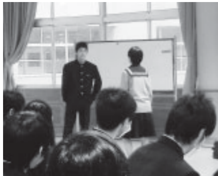
▲生徒会役員によるデートDVのロールプレイ

暴力には、殴る・蹴るといった身体的な暴力の他に精神的な暴力も含まれます。その例としては ・メールの返信をすぐにするように強要する。