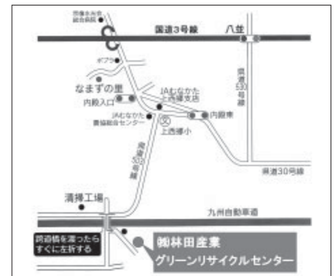
林田産業グリーンリサイクルセンター地図

今までと回収場所・時間が大きく変わることにより、市民の皆さんにはご不便をお掛けすることになりますが、公設分別ステーション付近の環境悪化の緩和・地域分別の推進のため、ご理解、ご協力いただきますようよろしくお願い申し上げます。