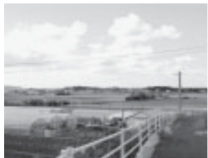
▲現在の小字古浜付近

勝浦塩田の沿革を記録した、元文五年(1740)頃の「勝浦村字塩浜築切開一切写簿」に、「古浜分塩浜」が田地になったため、「新塩浜」に代地を渡したとの記事があります。この中の「新塩浜」は寛文八年(1668)に造成された勝浦塩田のことで「古浜分塩浜」は、その勝浦塩田ができる以前に塩をつくっていた塩田と考えられます。記事の中の「古浜」が地名であるとは限りませんが、あんずの里の西側には「古浜」という小字名があります。この近くに「古浜分塩浜」があったのかも知れません。なお、永享九年(1437)の「応安神事次第 追補」に勝浦から宗像宮へ塩を納める記事があるため、勝浦の塩づくりは室町時代には始まっていたとされます。▲現在の小字古浜付近