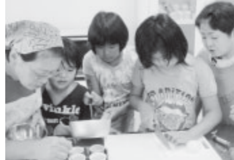
▲夏休み「料理教室」の様子