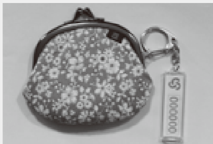
キーホルダーは、外出時に 持って行きましょう

緊急時、災害などで避難しなければならない場合に家族などの支援が難しく、地域など支援団体からの支援を希望する人は、福祉課窓口で登録の手続きができます。