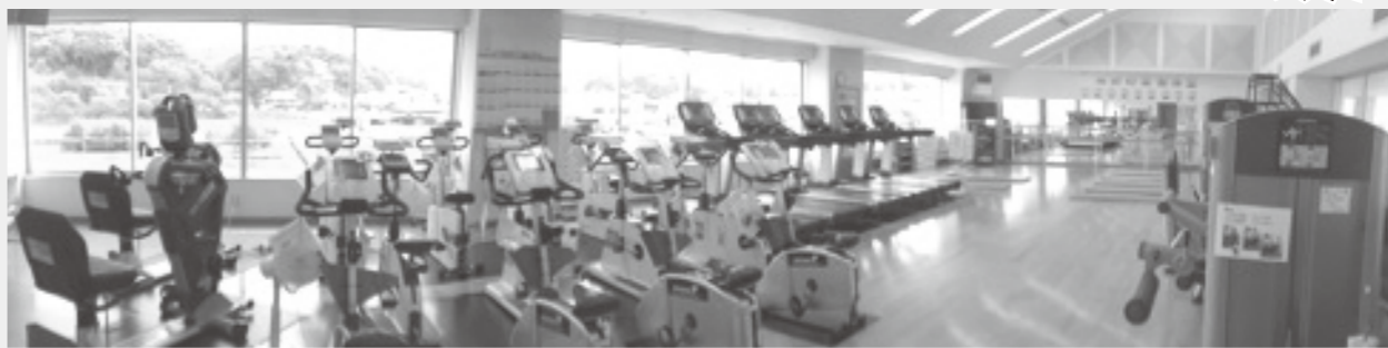
PRO II : 腕脚連動自転車 (2台) 自転車エルゴメータ (12台) ウォーキング・ランニングマシン (5台) 筋力トレーニング機器 (4種類)

ストレッチマット、踏み台、チューブ、バランスボール、バランスディスク、ダンベル など備えています