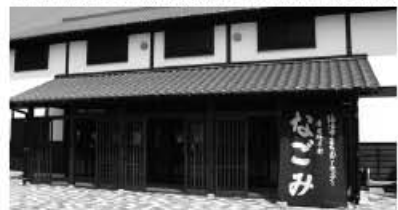
▲土・日曜日、祝日は「まちおこしセンターなごみ」へ行く!