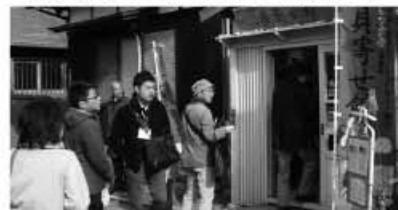
▲活動拠点「貝寄せ館」にも津屋崎の歴史がたくさん!