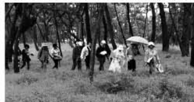
▲風景を楽しみ歩く「津屋崎里歩きフットパス」