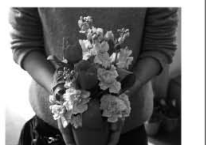
「贈る」教室の作品イメージです

ストック、トルコキキョウ、バラなど、春の訪れを感じさせる色とりどりの花々。福津が産地であることを皆さんご存じですか。市場で品質が高いと評価されている、自慢の花でもあります。その花々を集合させた「福津の花学校」を開校します。 花農家さんなどによるフラワーアレンジ教室や、福津にはあまり流通しない高級花をはじめとした自慢の花々の展示・販売など、とにかく盛りだくさんの2日間です。花いっぱいの会場へ、ぜひ、遊びに来ませんか!