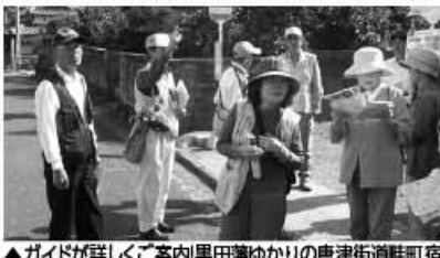
▲ガイドが詳しくご案内黒田藩ゆかりの唐津街酒造町宿