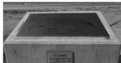
▲陽の沈む時刻と方位などが分かる夕陽風景時計