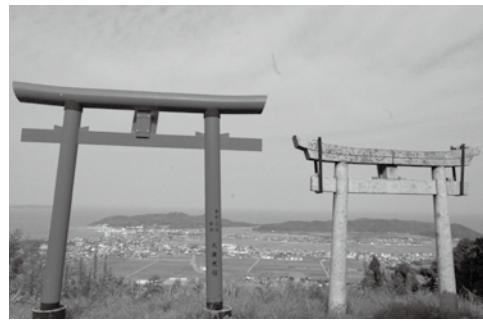
▲在白山展望所からの景色