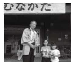
街頭キャンペーンの様子

8月1日、筑後川から水の供給を受けている福岡都市圏で一斉に街頭キャンペーンが行われました。福津・宗像市内でも水道水が貴重な資源であることや、その有効利用を呼び掛けました。