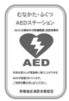
▲この標章が目印です

9月に福津市内の中学校から15人の生徒たちが職場体験に来ました。普段経験することのない厳しい訓練に生徒たちは驚いた様子でした。しかし、訓練を行っていくうちに学校間の垣根を越えて、互いに協力し、励ましあって無事に職場体験を終え