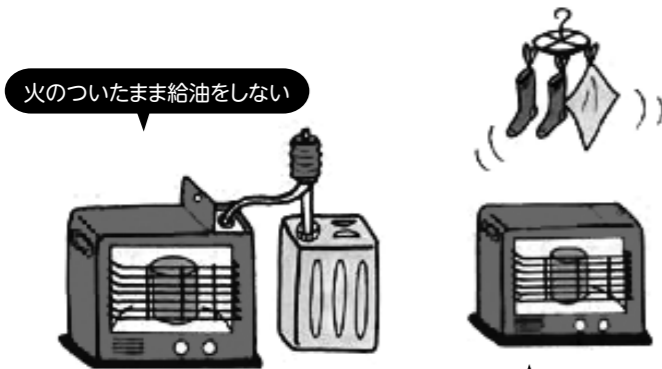
火のついたまま給油をしない

分に負荷がかかり断線して火災になることがあります。 3. テーブルタップを使用し、たこ足配線を行っていると、テーブルタップの許容量以上の電気が流れ、電源コードが過熱して火災になることがあります。