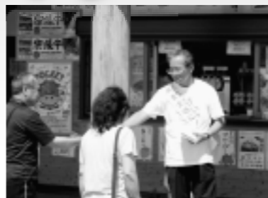
街頭キャンペーンの様子