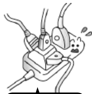
タコ足配線をしない