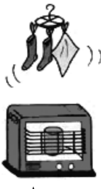
ストーブの上に物を干さない

暖房機器には、石油ファンヒーターや電気ストーブなど、多くの種類があります。 1. ふとん、カーテンや新聞紙などの燃えやすいものそばで使用しない。 2. 石油ストーブや石油ファンヒーターなどに給油するときは、必ず火を消す。 3. 石油ストーブや電気ストーブの上に洗濯物を干さない。