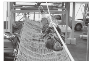
ロープ渡過訓練の様子

人の命を救う大切さ、そして大変さを肌で感じることで、これからの人生に役立ててほしいと思います。また未来の消防士が出てきてくれることを期待しています。