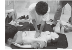
救急活動訓練の様子