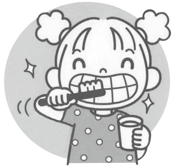
●福津市いきいき健康課

「80歳で20本以上の歯を保とう」というのが8020運動です。当日は、クイズラリーや手型の石こう模型プレゼントなど楽しい催し物がいっぱいあります。「歯に良いおやつ」の展示や試食、薬剤師会による禁煙指導、在宅介護相談やジェネリック医薬品相談の受け付けもします。家族そろって参加ください。事前予約不要です。 内容 無料歯科健診、健康相談、親子の良い歯のコンクール(対象は3歳児とその親)、フッ素塗布とブラッシング指導、歯周病やかむ力のチェックほか 日時 11月7日(土) 午後1時~午後4時 場所 ふくとぴあ 問い合わせ 宗像歯科医師会 ☎36・7160