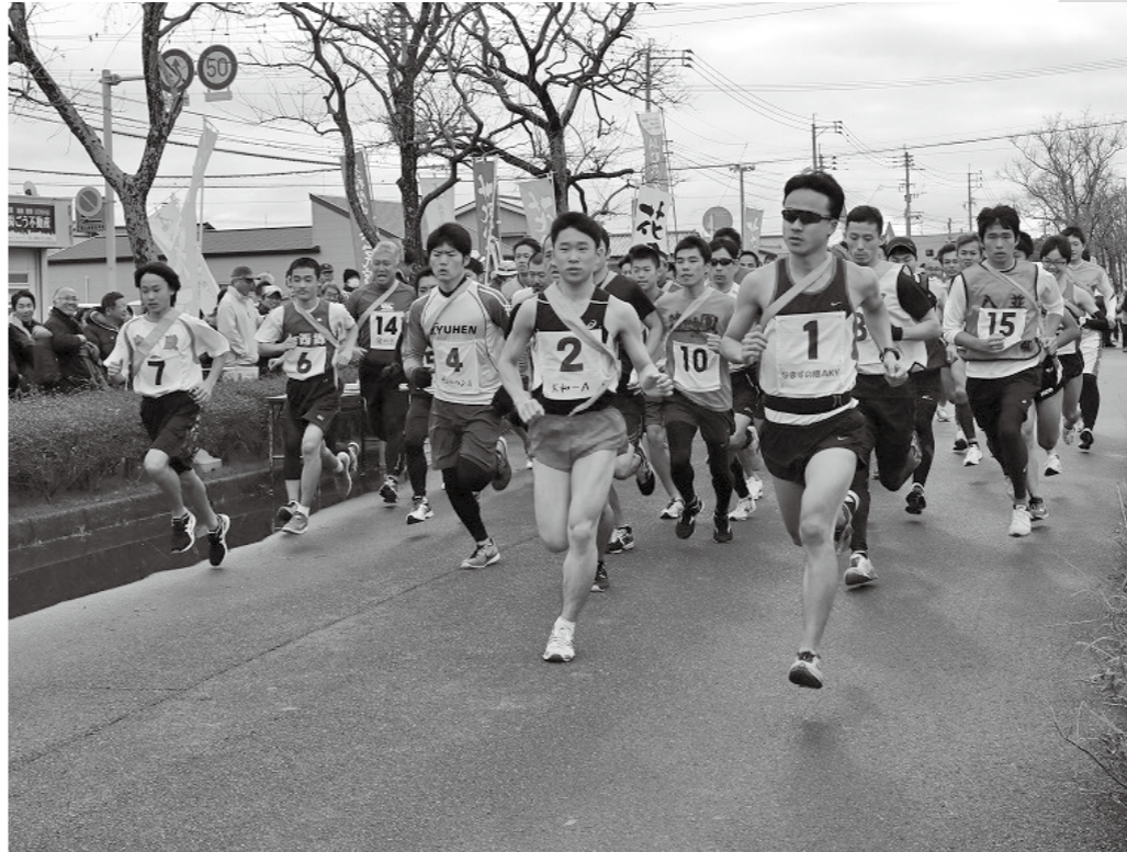
▲昨年度の駅伝競走大会の様子

①② 共通事項 受付期限 12月15日(金) 受付、問い合わせ 市郷育推進課 ☎62・5079 FAX 43・9004 Email goiku@city.fukuoka.jp ※ファクスやメールでの応募の場合は、送信後に確認の電話をしてください。