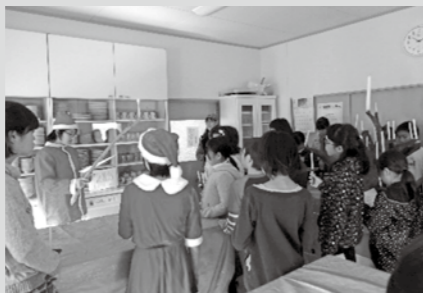
▲昨年のクリスマス会の様子

ジュニア・リーダーは、各子ども会へ出かけ活動の応援もします。関心のある方はご相談ください。 問い合わせ 市子ども会育成会連合会事務局 ☎52・1172 ※火曜日の正午～午後3時と土曜日の午前10時～午後1時