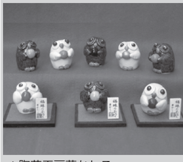
▲陶芸工房夢かしこ

「福津の極みの店」を今年も宮地嶽神社参道沿いの店舗で、期間限定で開店します。今年の干支の戌や、ふくろうなど縁起ものの工芸品に加えて、黒豚まん、鯛茶漬などの販売も行います。また、ふ