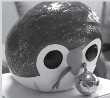
▲筑前津屋崎人形巧房