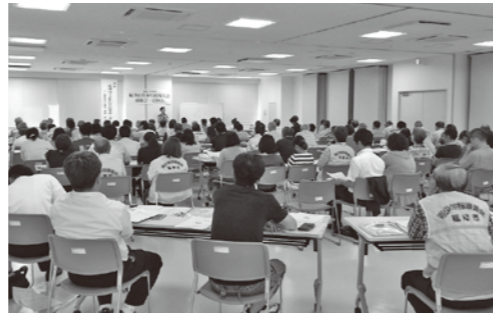
▲地域でのさまざまな活動に協力しています

青少年指導員会では、各自治会から選出された人や警察から委嘱された指導員が校区ごとに活動しています。定期的なパトロールや各地域で行われる行事や祭りでの巡回を実施しています。警察署から地域の現状の報告や活動への助言を受け、青少年の非行・非行被害防止に関する広報活動や青少年の安全安心に関して地域と連携して継続した活動に取り組んでいます。