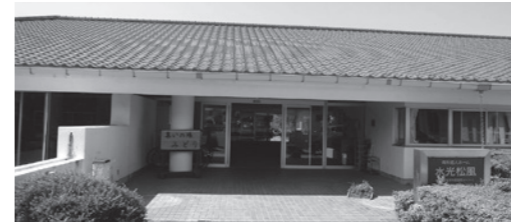
▲「みどり」は老人ホーム水光松風の中にあります

市内の人が誰でも気軽に立ち寄れる集いの場「みどり」が西福間にあります。「みどり」には、高齢者や子どもたち、障がい者や障がい児、子育て世代の人などさまざまな世代が集まっています。