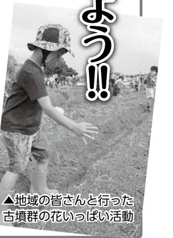
▲地域の皆さんと行った古墳群の花いっぱい活動

世界遺産に登録された「新原・奴山古墳群」の保存や整備、活用を進めるため、来年度にかけて新たな計画づくりに取り組みます。地域の皆さんをはじめ、市民参加で新原・奴山古墳群の未来の姿を描きたいと考え、ワークショップを開催します。 定員 30人 ※応募多数の場合は選考 応募要件 次の3点を満たす人 ①市内在住あるいは通勤している人 ②ワークショップに継続して参加できる人 ③遺跡の保存や整備、活用、地域の活性化などに関心のある人 受付期限 10月16日(金) 受付方法 メールまたはファクスで、住所、氏名、電話番号、