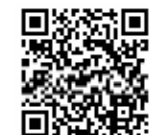
▲市公式ホームページQRコード

問い合わせ 福津市感染防止対策給付金専用ダイヤル ☎62・6083 ※受付時間は土曜・日曜日、祝日を除く午前9時～午後5時