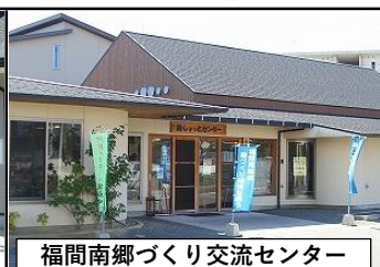
福間南郷づくり交流センター