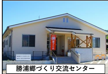
勝浦郷づくり交流センター