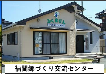
福間郷づくり交流センター