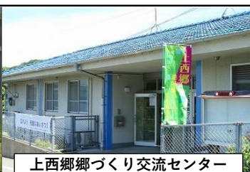
上西郷郷づくり交流センター