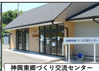
神興東郷づくり交流センター