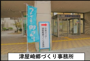
津屋崎郷づくり事務所