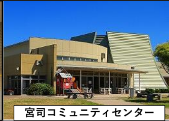
宮司コミュニティセンター