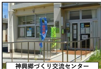
神興郷づくり交流センター