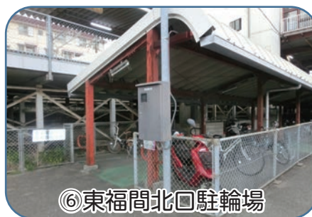
⑥東福間北口駐輪場