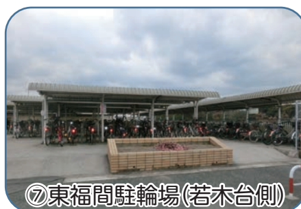
⑦東福間駐輪場(若木台側)