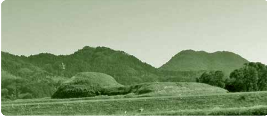
新原・奴山古墳群（世界遺産に決定）

平成29年度一般会計補正予算 14億3115万円を追加し 総額 216億5080万円