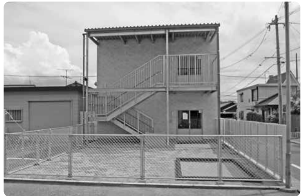
福間小学校学童保育所（第3・第4）

福間小学校学童保育所は学校の敷地内に2教室分定員90人があるが、校区再編などに伴い福間体育センター駐車場内に2教室分定員90人を増設するもので、新施設の指定管理者も現福間小学児童保育所運営委員会に決まった。