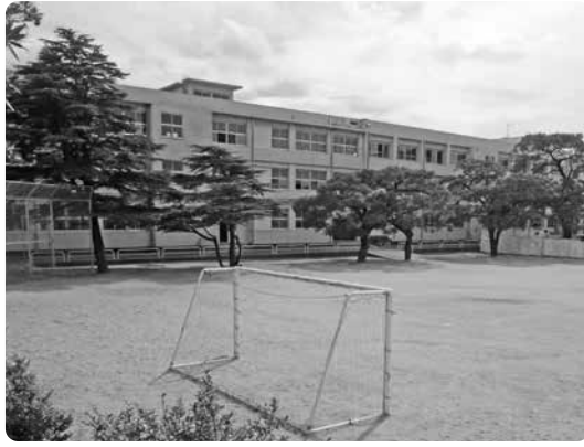
建て替え前の福間小学校

福間小学校は、校舎が築50年を経過し、新耐震基準を満たさず、建て替えが必要である。 工期 平成30年9月30日まで 契約金額 12億3120万円 業者 東急・松崎特定建設工事 共同企業体