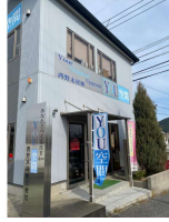
第2弾「西野木材株式会社」