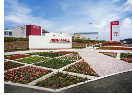
第3弾「イオンモール福津」