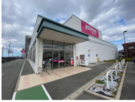
第1弾「ゆめマート福津」

エコショップがどんなことをしているのか市民のみなさまに知っていただくため、3つのエコショップにインタビューしたので紹介します♪