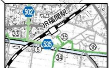
▲景観重要公共施設位置図