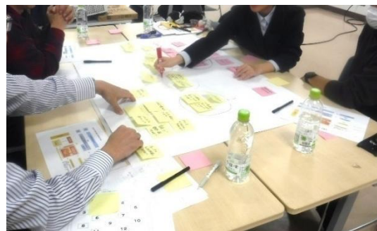
「福津市の新しい教育プラン策定のためのワークショップ」の開催経過