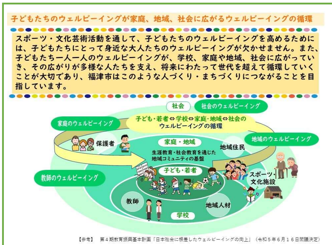
図 2:ウェルビーイングの循環

したがって、福津市では、すべての子どもたちのウェルビーイングの実現を目指して、学校部活動の新たなカタチとして社会総がかりで共に創る「福津市認定地域クラブ」の創設により、学校部活動の地域展開を進める。