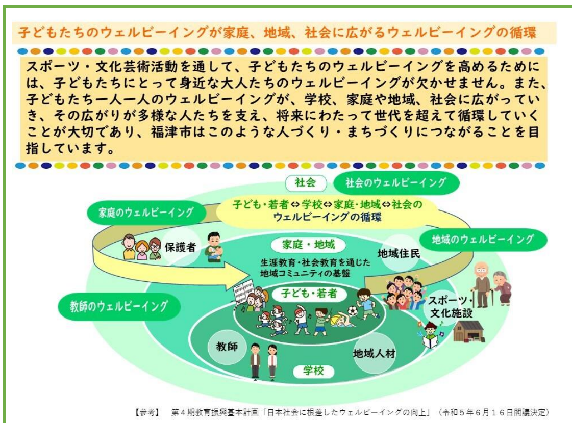
図 2:ウェルビーイングの循環

したがって、福津市では、すべての子どもたちのウェルビーイングの実現を目指して、学校部活動の新たなカタチとして社会総がかりで共に創る「福津市認定地域クラブ」の創設により、学校部活動の地域展開を進める。