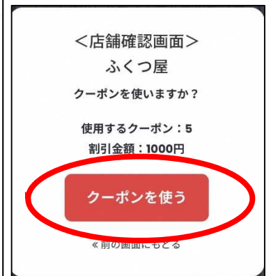
お店のスタッフに 見せながら押す

お買い上げ1,000円(税込)ごとに1枚(200円引き)使用可能。最大5枚(1,000円引き)まで