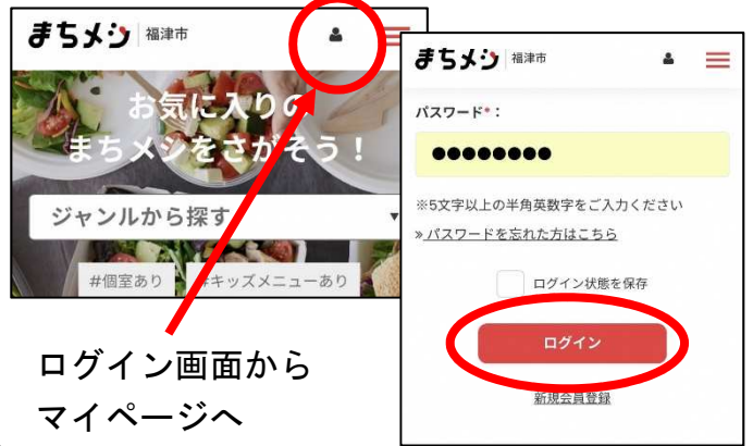
ログイン画面から マイページへ