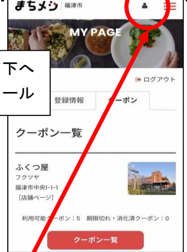
取得したクーポンはマイペ ージより確認できます