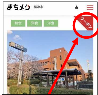
このマークを確 認し、写真部分 を押す