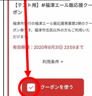
「クーポンを使う」を押す