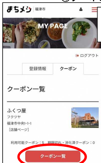
ボタンを押し、一覧より使用したいお店のクーポンを選択