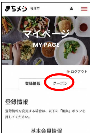
マイページのクーポン