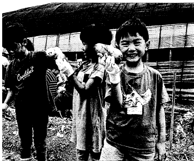
とじゃがいもの大きさを比べる子どもたち