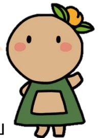
新原・奴山古墳群マスコットキャラクター 「ふんちゃん」