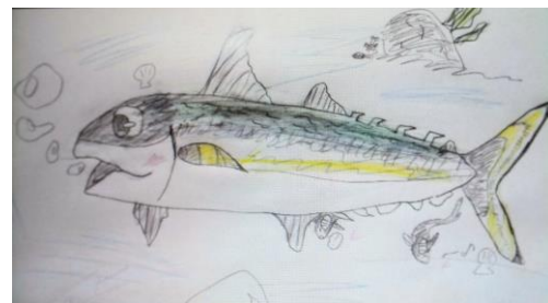
4年生になって描いた魚