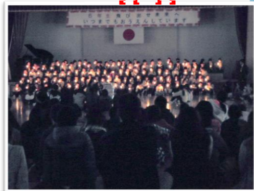
一斉の拍手で卒業生118名が迎えられました。118名の胸にキャンドルが灯されました。